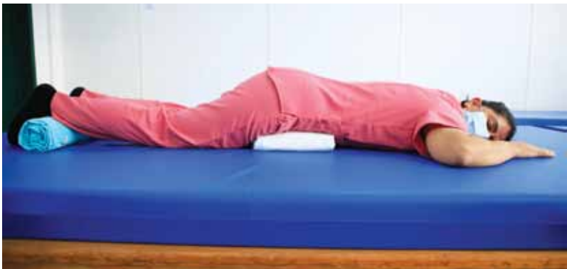
Puede usar almohadas, sábanas o toallas.