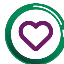
Enfermedades del corazón