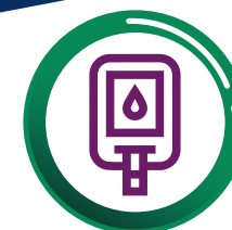
Complicaciones de diabetes mellitus