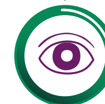
Alteraciones de la vista