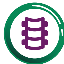
Enfermedades de la columna