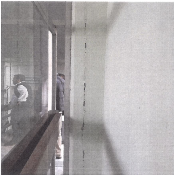
En Hospitalización área de consulta de especialidades, se observa desprendimiento de aplanado en columna.