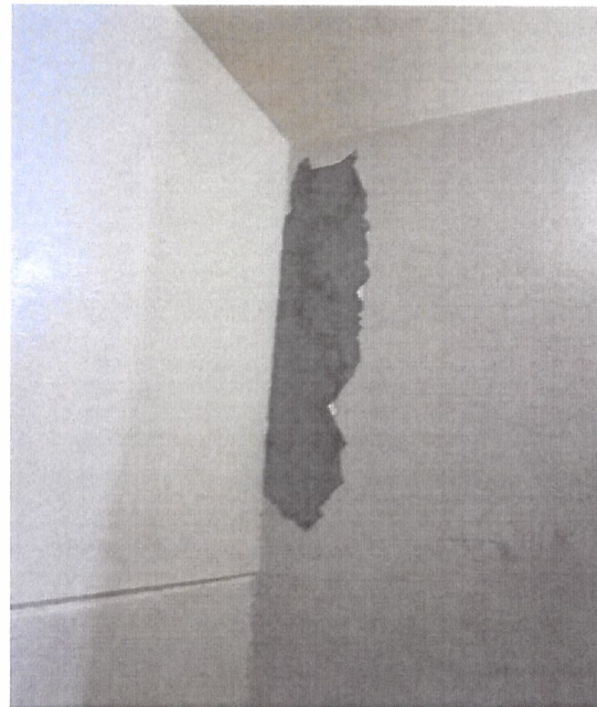
En edificio de Hospitalización área de escaleras principales, solo se observa desprendimiento de pasta en muro