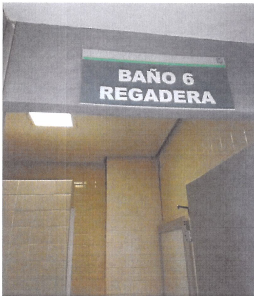
En Hospitalización piso 9 "División Cirugía" en área de baños y regaderas, solo se observa desprendimiento de azulejo entre muro y columna.