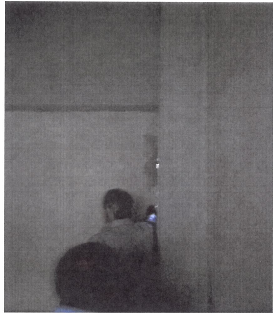
En edificio de Hospitalización área de cubo de escaleras de emergencias "Clausurada" se observa separación entre muro y la columna así como desprendimiento del recubrimiento de pasta.