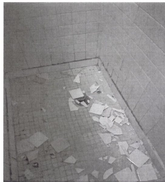
En Hospitalización área de regaderas, solo se observa desprendimiento de azulejo.