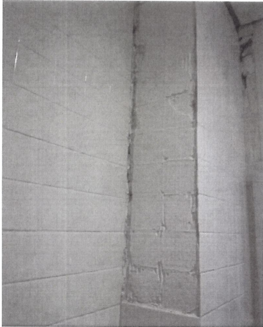
En edificio de Hospitalización solo se observa desprendimiento de azulejo en cajillo de instalaciones