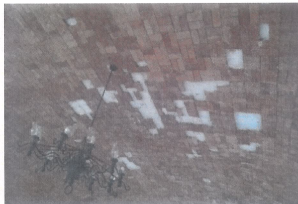
Restaurante del Centro Vacacional de Oaxtepec, donde se aprecian daños en acabados.