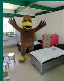
UMF No. 10 de Chinameca.