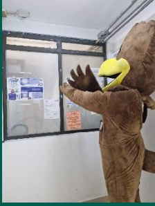
UMF No. 18 de Emiliano Zapata.