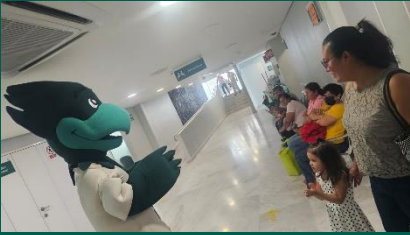
HGZ/MF No. 7 de Cuautla.