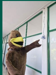
UMF No. 2 de Xochitepec.