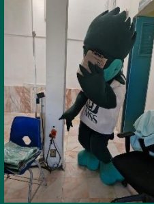
UMF No. 23 de Civac.