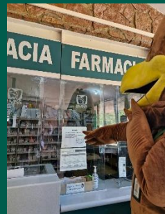
UMF No. 6 de Puente de Ixtla.