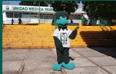
UMF No. 3 de Jiutepec.