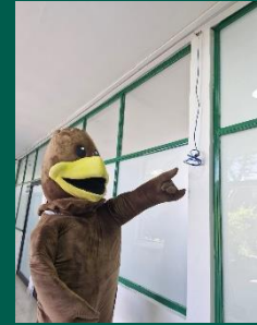
UMF No. 2 de Xochitepec.