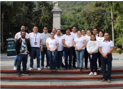
Jefatura de Servicios Administrativos.