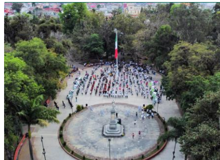
Macro Activación 81° Aniversario del IMSS.