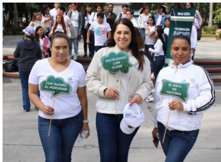
Jefatura de Servicios Administrativos, Coordinación de Competitividad y Orientación al DH.