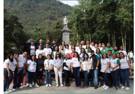
Jefatura de Salud en el Trabajo, Prestaciones Económicas y Sociales.