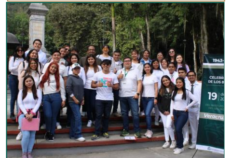
Médicos Residentes y Pasantes de UMF No. 1.