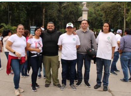
Coordinación de Informática.