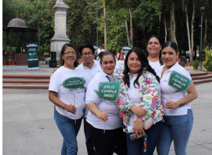
Departamento de Prestaciones Económicas