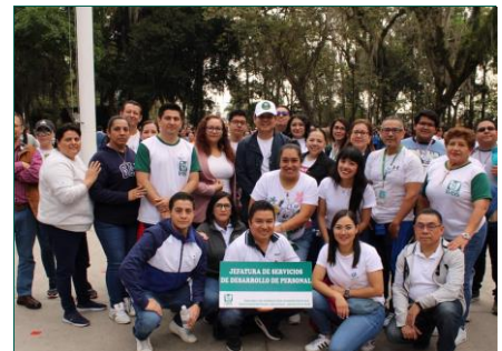
Jefatura de Desarrollo de Personal.