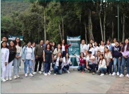
Unidad de Medicina Familiar No. 1, Orizaba.