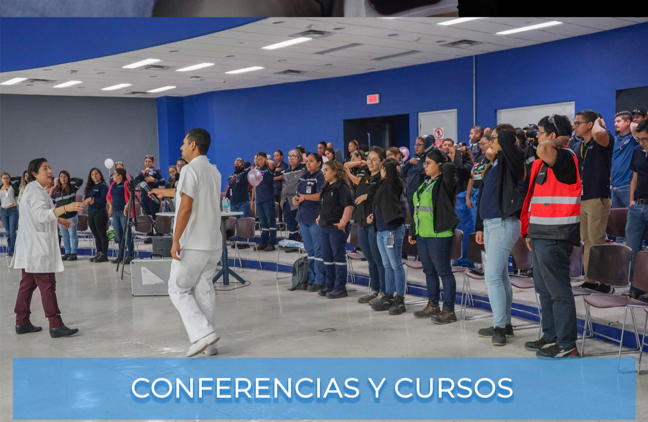
CONFERENCIAS Y CURSOS