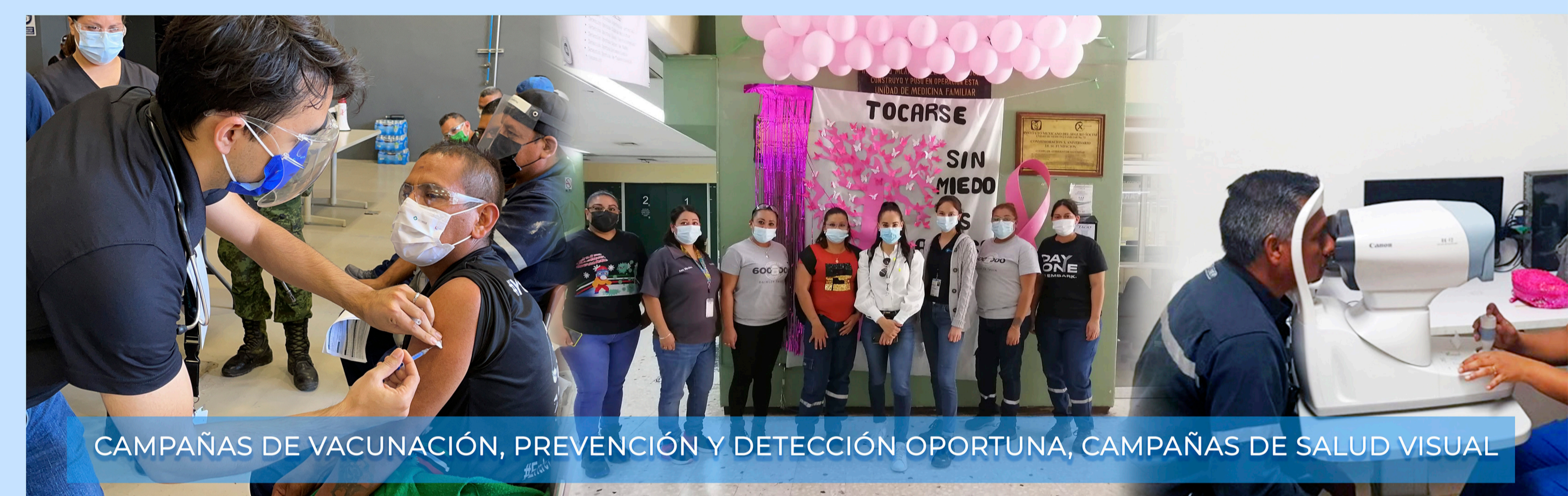
CAMPAÑAS DE VACUNACIÓN, PREVENCIÓN Y DETECCIÓN OPORTUNA, CAMPAÑAS DE SALUD VISUAL

Descripción de la Buena Práctica y aplicación: con la participación total de los empleados y sus familias, sindicato, clientes, proveedores, universidades, organizaciones gubernamentales y asociaciones, se lleva a cabo un programa mensual de campañas de salud, seguridad, bienestar y servicio comunitario, lideradas por el equipo gerencial de Daimler Vehículos Comerciales México, planta Saltillo.