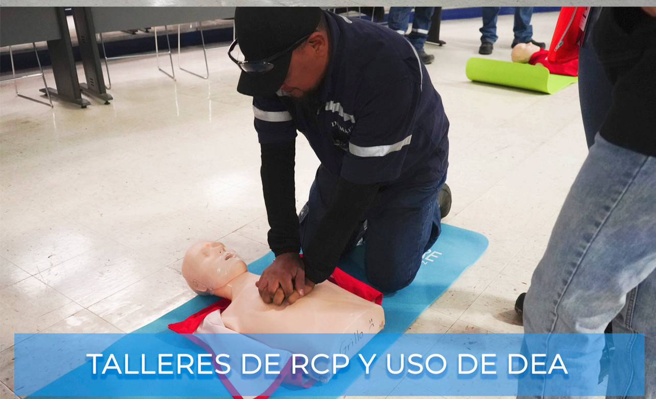
TALLERES DE RCP Y USO DE DEA