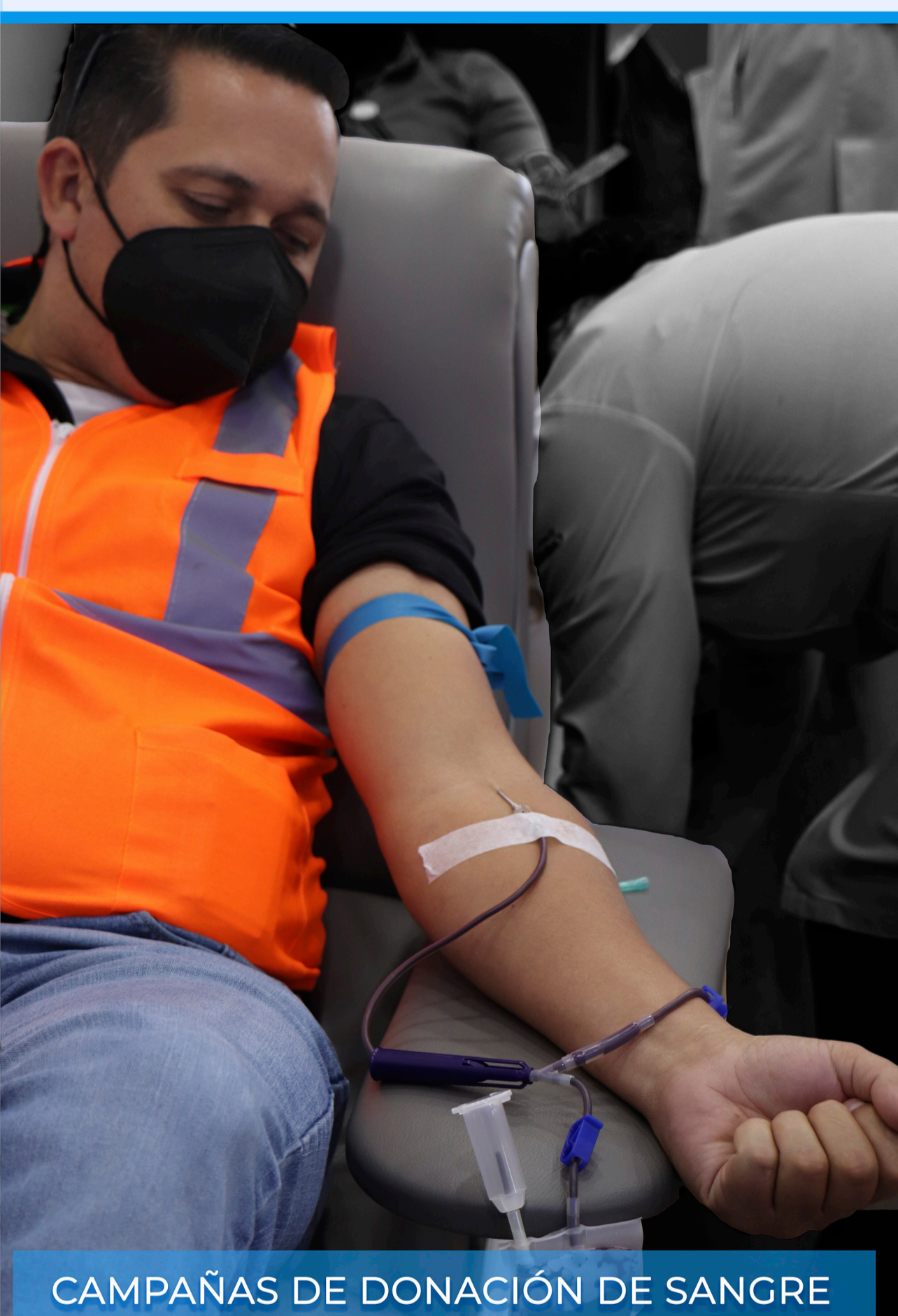
CAMPAÑAS DE DONACIÓN DE SANGRE